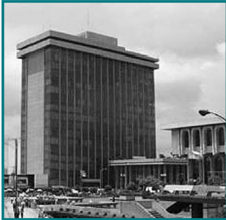
Ministerio de Finanzas Públicas de Guatemala.

para que sean aprobadas en el primer periodo de sesiones 2 . Estas reformas van orientadas a garantizar la equidad, simplicidad y suficiencia de recursos. Se basa en una reforma integral del Impuesto sobre la Renta, combatir la evasión fiscal y fortalecer el IVA, especialmente en las aduanas y los vehículos. Como mínimo se espera alcanzar la carga tributaria del 13.2% del PIB, meta actualizada dentro de los Acuerdos de Paz del año 1996. Esto significaría elevar la carga en casi el 1% del PIB. Estaríamos hablando de alrededor de Q. 2 mil millones adicionales. Ya identificadas las prioridades y problemas sociales que el gobierno tiene que atender, con el Concejo de Cohesión Social en el primer semestre del presente año se movilizarán recursos hacia el gasto social, buscando un financiamiento sano y sostenido, con un esfuerzo de país y de Nación.