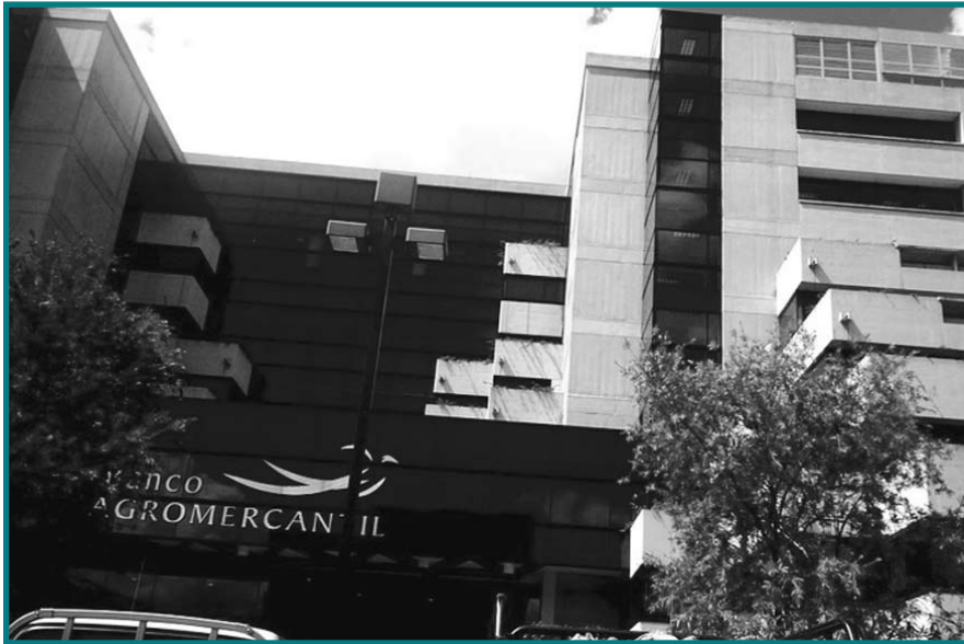
El Banco Agromercantil, ha financiado varias campañas políticas.