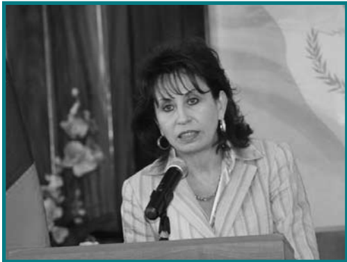
Sandra Torres Primera Dama y Coordinadora del Consejo de Cohesión Social.

ya que desde principios de la década de los años de 1980 se involucró en ese negocio. En 1982 asumió la Dirección de la Comisión de Vestuario y Textil (VESTEX) de la entonces recién creada Gremial de Exportadores de Productos No Tradicionales (GEXPRONT) 39 , que era parte de la CIG, y formó parte del Consejo Consultivo de esa gremial. Ese nexo con el sector textil lo convirtió en uno de los más importantes empresarios de esa industria en el campo de las maquiladoras, o empresas de subcontratación dedicadas a tareas intensivas de montaje y producción orientadas a la exportación.