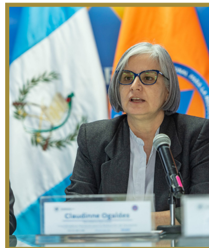
Claudinne Ogaldes Cruz de Barral.

De acuerdo con la CONRED 23 , la Dra. Ogaldes tiene conocimiento y experiencia en materia de defensa, seguridad y gestión de riesgos, ha ocupado funciones de gestión institucional en el diseño e implementación organizacional y técnica de varias instituciones, práctica en metodologías de acción participativa en materia de procesos de gestión y transformación de conflictos, prevención de la violencia y gestión de riesgos, así como investigación social.