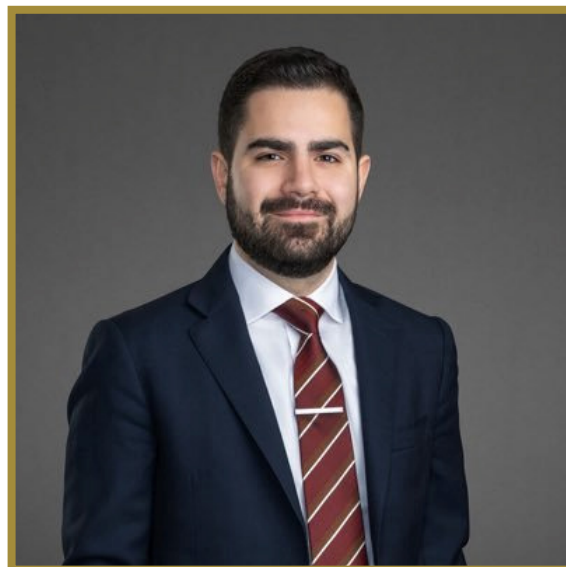
Santiago Palomo Vila.

En la CC estuvo muy cercano a la ex Presidenta y actual Magistrada de la Corte de Constitucionalidad (CC), Dina Ochoa Escibá.