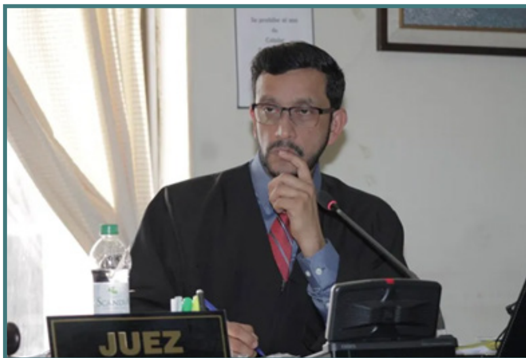
Víctor Cruz, juez del Juzgado Décimo Pluripersonal de Primera Instancia Penal, que actualmente lleva la carpeta del “Caso Toma USAC: Botín Político”.

Además, las decisiones de los jueces le dan una apariencia de legalidad a casos débiles y mal planteados por el MP; todo para hacer creer que se cumple con el debido proceso.