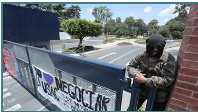
La crisis de la USAC ha provocado la falta de credibilidad y la confianza social hacia la otrora universidad del pueblo.

El impacto social ha sido devastador: la USAC pierde su prestigio histórico, mientras las universidades privadas de baja calidad proliferan, generando una precarización del valor académico y un aumento en la desigualdad social. Se ha producido un debilitamiento en la representatividad institucional, donde la rectoría usa prebendas y favores para sostener poder, sacrificando la independencia universitaria y la función social que debe cumplir una universidad pública 45 .