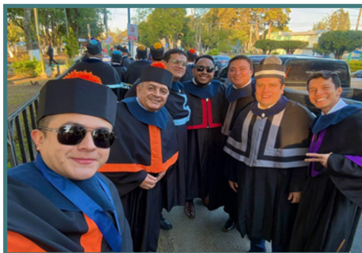
Algunos miembros del CSU actual a pesar de los señalamientos no dudan en mostrarse en redes sociales.

Para marzo de 2026, la rectoría encabezada por Mazariegos Biolis repitió sus estrategias fraudulentas para designar Magistraturas a la Corte de Constitucionalidad (CC), así como para la próxima elección de nuevo rector que deberá quedar finiquitada en abril del presente año.