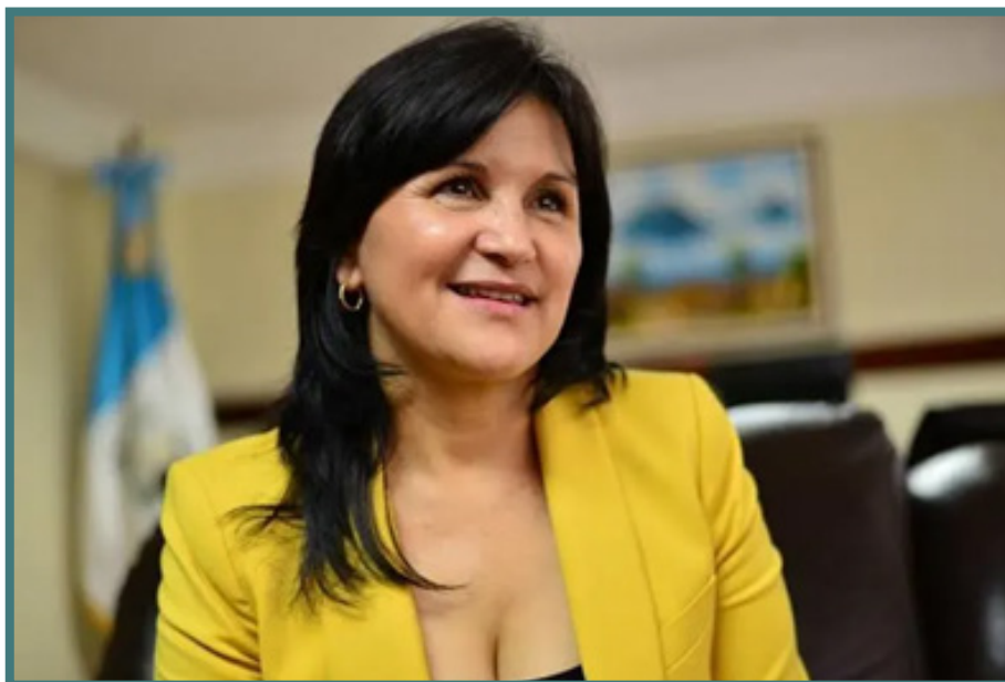
Gloria Porras Escobar

Olympto Paiz Recinos, cuando el CSU eligió a Gloria Porras Escobar como Magistrada Titular para la CC para el periodo 2021-2026, tras 12 rondas de votación en el Grand Tikal Futura Hotel.