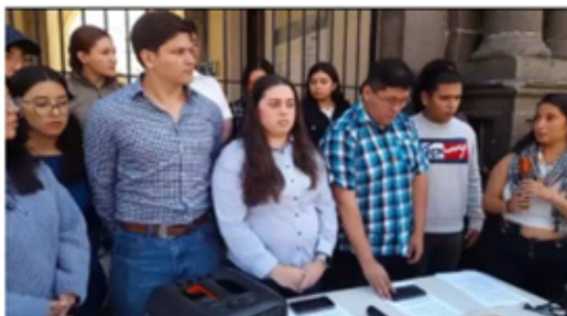
El Observador Guatemala (@EObservadorGT) on X

El 30 de marzo, la Sala Sexta del Tribunal de lo Contencioso Administrativo resolvió suspender en definitiva el trámite de un amparo que fue presentado por miembros de siete cuerpos electorales estudiantiles contra el CSU, quienes buscaban que éste acreditara a todos los electores para la elección de rector. En la resolución, la Sala Sexta argumentó que “la amenaza denunciada por los amparistas no resulta ser cierta e inminente”, debido a que no se demostró que el CSU esté próximo a realizar actuaciones que conlleven transgresión a los derechos constitucionales. A esa fecha, otras acciones de amparo en contra del CSU no habían sido resueltas, ya que en esa misma Sala Sexta hay al menos otros dos amparos que estaban pendientes de ser resueltos, los cuales fueron presentados por profesionales egresados y también por docentes de la USAC. Además, hay al menos otros cuatro amparos que están distribuidos en la Sala Primera y en la Sala Quinta del Tribunal de lo Contencioso Administrativo, que también estaban a esa fecha pendientes de ser resueltos*.